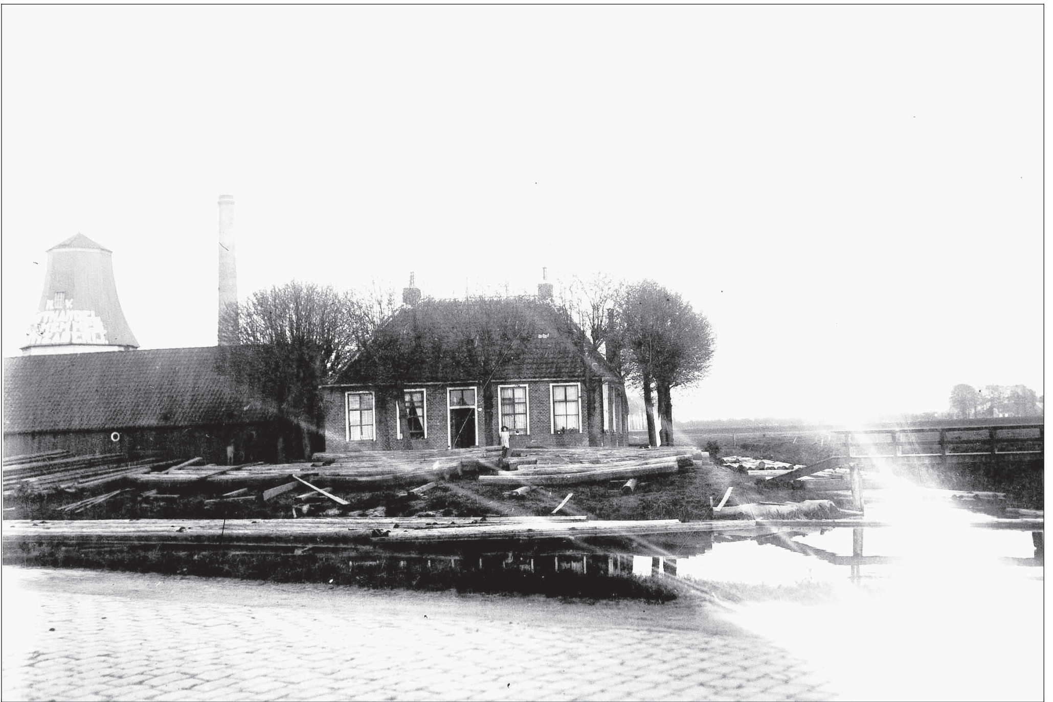
De N.V. Houthandel en zagerij J.L. Hemmes in Oosterhoogebrug, 1924.